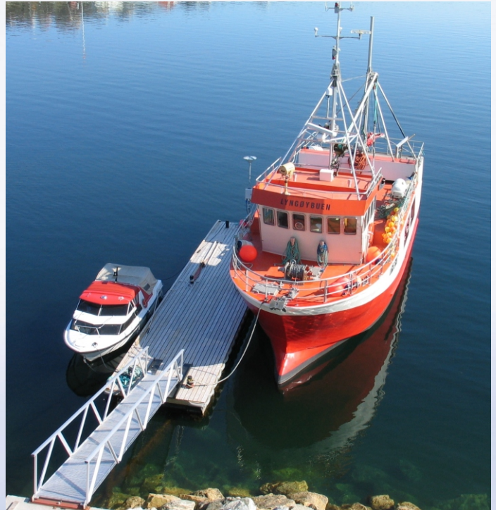
NOFI ROBUST, 3 x 15 meter med 500 mm flyterør.

Andre lengder, bredder og dimensjoner av NOFI ROBUST kan spesialbestilles.